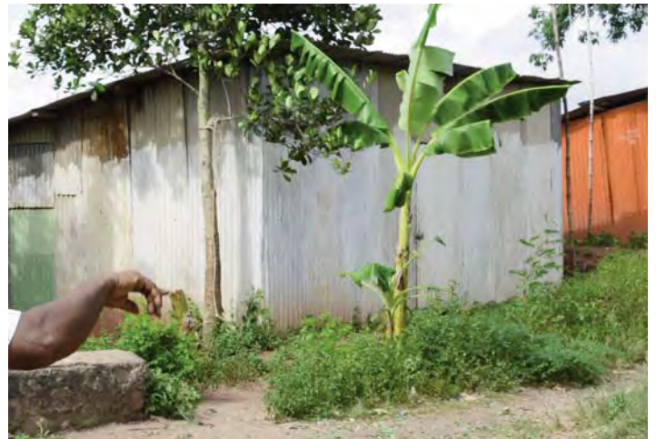
Les bangas avaient été désertés

Et justement, du côté des « déménageurs », là aussi on pointe les